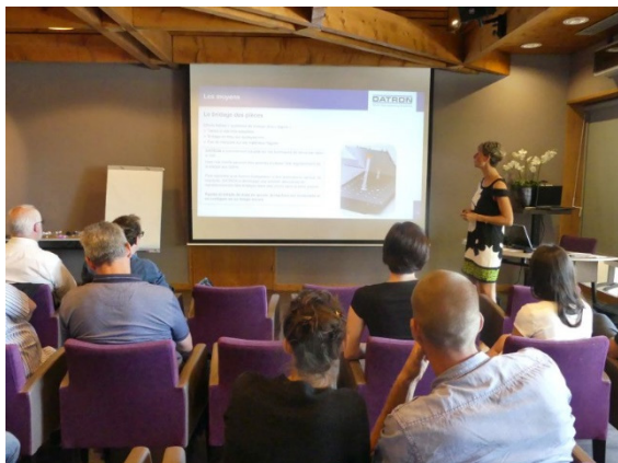
Figure 1 Un partenariat 3idm / DATRON : L'Usinage Grande Vitesse

Les 20 et 21 juin 2017, 3idm, revendeur Mastercam était présent aux Journées Portes Ouvertes DATRON France .